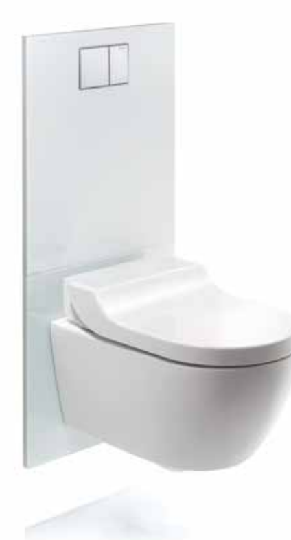
↑ Płyta ozdobna Geberit AquaClean

Jeśli na ścianie jest już zainstalowana sptuczka lub po prostu nie można jej ukryć w ścianie ze względów czasowych, budżetowych lub bazowej konstrukcji budynku, kolejnym rozwiązaniem, jakie można zastosować, jest moduł sanitarny Geberit Monolith. Za elegancką szklaną powierzchnią ukryty jest ultrasłukowy zbiornik wraz z całą niezbędną techniką sanitarną. System Monolith został zaprojektowany z myślą o szybkim i bezproblemowym montażu i można go podłączyć do wbudowanych węży wodnych i rur spustowych.