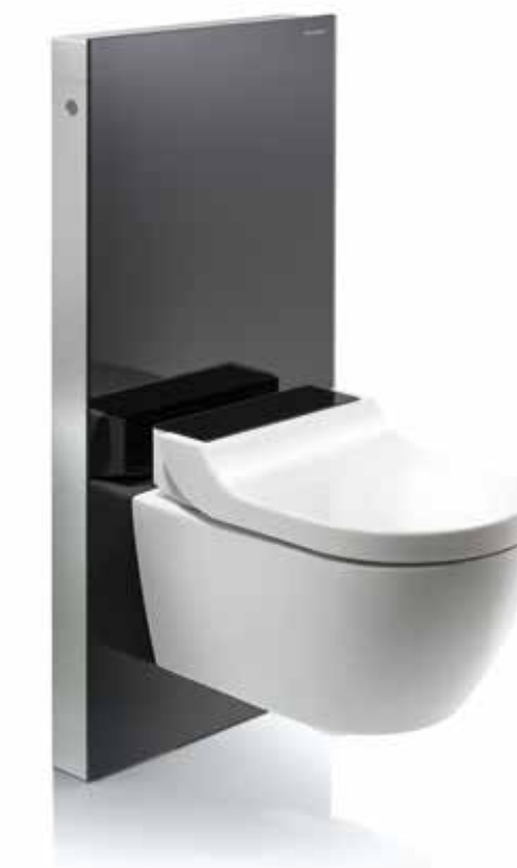
↑ Moduł sanitarny Geberit Monolith

W idealnym scenariuszu hydraulik oznaczyłby już gniazdo elektryczne przy toalecie na potrzeby ustanowienia wymaganych połączeń sieciowych. Jednakże można podłączyć toaletę do źródła zasilania w dowolnym miejscu w łazience za pomocą konwencjonalnego gniazda zasilania i tunelu kablowego. Możesz błyskawicznie zmienić swoją łazienkę w oazę komfortu.